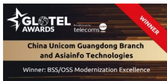
2023, GLOTEL “BSS/OSS现代化卓越奖”