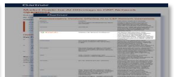
2022 – 2024, Gartner 网络 智能化全球主流供应商矩阵