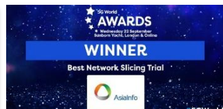
2020, 5GWorld “5G切片全球最佳实践奖”